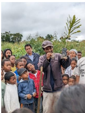
苗木の扱い方の説明