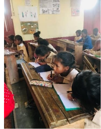
講師の説明を聞く生徒