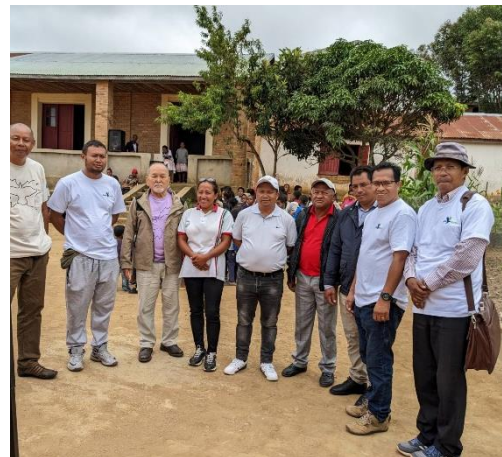
校長や市長たちとの写真