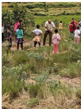
みんなで苗木を植える