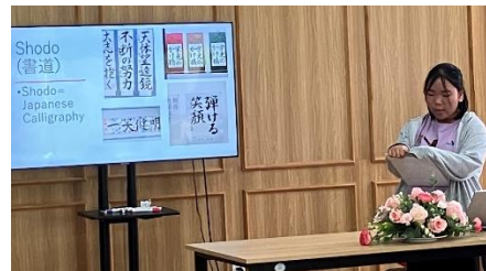
プレゼンする日本人参加者