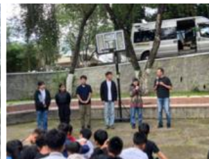
ルール説明 (SOS Village)