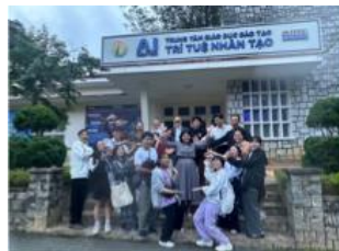
参加者一同(ダラット大学)

SOS Village を訪問した。3歳から18歳ほどの子どもたちと一緒に、「アブラハムの子」や「じゃんけん列車」などの遊び、後に子どもたちが暮らしている家を見学した。夕食後、飛行機でホーチミンへ移動した。