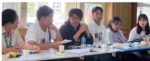
プレゼンを待つ日本人参加者5名