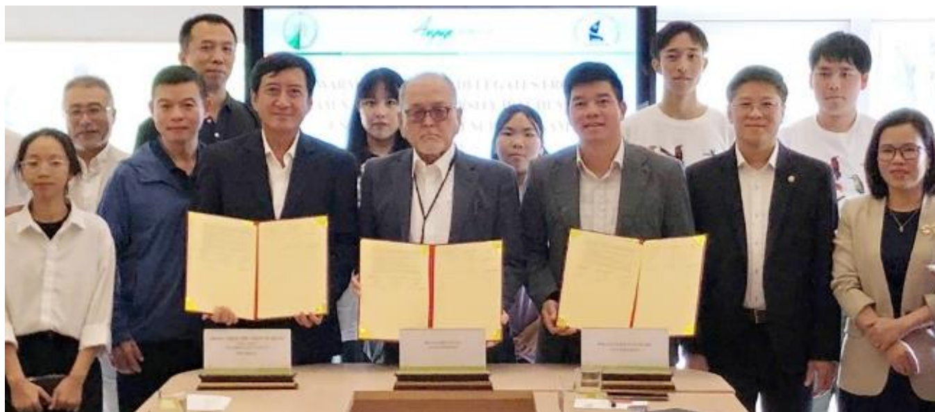
中央3名: 左より、ホーチミン市自然科学大学学長、アイユーゴー理事長、ダラット大学副学長

国際 NGO アイユーゴーとホーチミン市自然科学大学ならびにダラット大学との協力関係を継続し、価値あるものにするために、3者が協定書にサインしました。