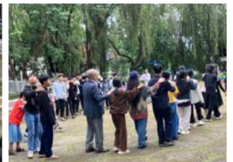
じゃんけん列車 (SOS Village)