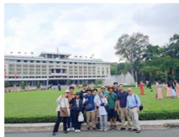
ホーチミン市内観光 統一会堂

昨年一部開業したホーチミンメトロやバス、タクシーに乗り、スイティエン公園、ホーチミン人民委員会庁舎前、サイゴン中央郵便局、タンディン教会、ベトナム戦争証跡博物館を訪問した。