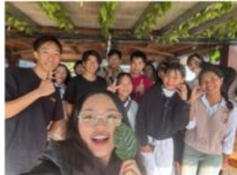
日本とベトナムの学生

午前、ダラット大学の学長を表敬訪問した。アイユーゴー、ホーチミン市自然科学大学、ダラット大学の3者は学術協力、学生交流プログラム、地域社会奉仕活動の実施における連携としていくことで