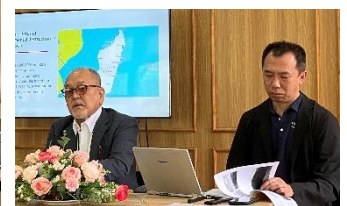
環境教育についてプレゼンする