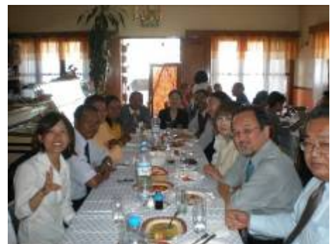
ムラマンガ市内レストランにて青年海外協力隊員と共に昼食