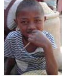
マダガスカル共和国ムランガ市の様子