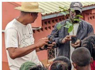
現場での実施指導：苗木の扱い方を説明