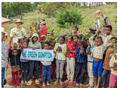
緑の募金から助成金をいただいています！