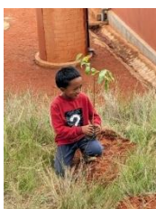
ここれでいいのかな？