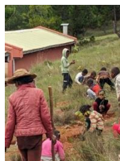
みんなで植えよう。