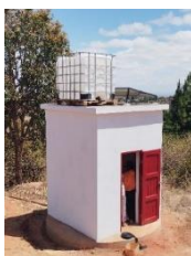
井戸は火事・乾季対策