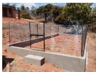
自分たちが苗木で苗木を育てて植林を