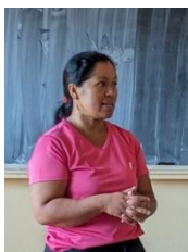
教室内では自然環境などの話を聞く。