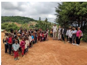
まずは本日の集合写真の撮影から