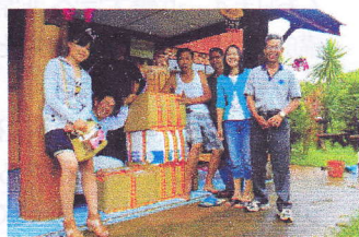
継続している古着の寄贈