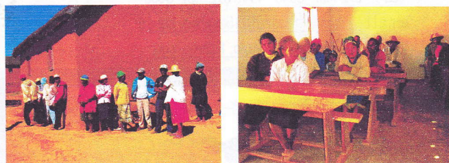
＜有機栽培の説明会の開催を待つ住民と会場内で説明を聞く住民＞ (マダガスカルにて)

ものであると考えています。この地球上で一緒に今を生きているという意味で、常に「ともにいる」状況になれるといい、と考え続けています。仲間として、互いに助け合える精神ではないかと考えます。