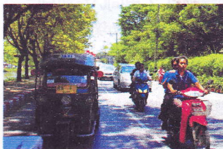
タイの道路の状況

今回タイに行きいろんなことを体験し、いろんな話を聞き、とても良い経験になり、そして勉強にもなりました。また機会があったら、タイに行きいろんなことを体験しもっとタイの事を知りたいと思いました。