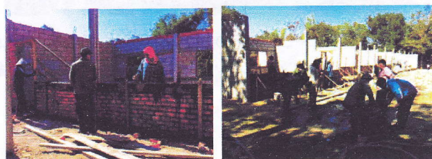
＜小学校建設に協力する村人＞(ラオスにて)

貧しい現状を打開するために、アイユーゴーが最も大切な活動と考えたことは、保護を求めてきた人を救済するための場所を建設することでした。それが貧困撲滅のための現地の活動拠点となり、彼らにとっての学びの場所となるからです。それが、農業支援センターであります。続いて、宿舍、試験場、井戸、タンク、パイプライン、グリーンハウスなどのウォーターシステムを整備してきました。さらに、職業訓練所や基礎教育のための小学校と図書館などを建設して、人材育成のための教育環境を整えてきました。